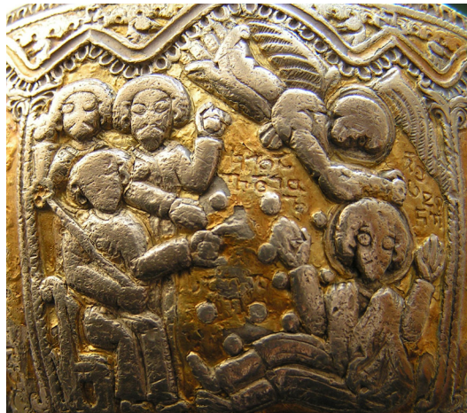
სურ. 2. „წმინდა სტეფანეს ქვით ჩაქოლვა“

ოთხი ფირფიტიდან ერთერთს ამშვენებს „მოციქულთა საქმენი“-დან აღებული სცენა: „წმინდა სტეფანეს ქვით ჩაქოლვა“ (სურ. 2). პირველი