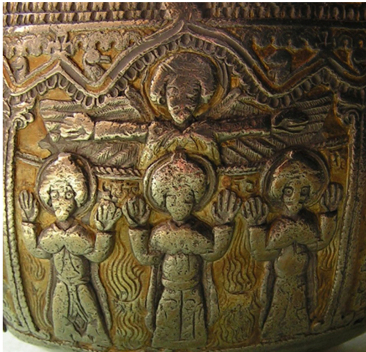
სურ. 6. „სამი ახალგაზრდა ცეცხლოვან ღუმელში“

ხელები და ფრთები გაშალა. ქვემოთ, ახალგაზრდების გვერდებზე, ცეცხლოვანი ენები ტრიალებს (სურ. 6).