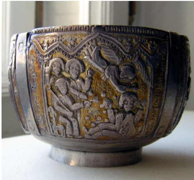
სურ. 1. საცეცხლორის საერთო ხედი

ჩვენ საშუალება მოგვეცა გავცნობოდით ძველი ქართული სტაციონარული საცეცხლორის ფოტოებს. ეს საცეცხლორი ამჟამად მოსკოვის კრემლის მუზეუმში ინახება და მისი საერთო ხედი ერთ-ერთ ფოტოსურათზე