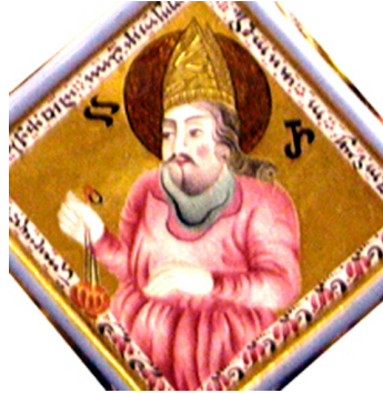
სურ. 4-4ა. მეფე თეიმურაზ II-ის კვერთხის თავი. აარონის გამოსახულება კვერთხზე

მარცხნივ მოყვანილი არის „სინათლის ანგელოზი“, მთავარანგელოზი გაბრიელი, კვერთხით, რომელსაც გვირგვინი აქვს ჰერალდიკური ლილიით და სარკის სფეროთი ხელში. სწორედ ეს კომპოზიცია აზუსტებს ამ თასის ფუნქციურ კავშირს თავყვანისმცემლობის ობიექტებთან - საცეცხლურთან.