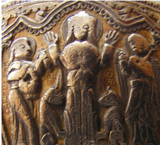
სურ. 5. დანიელ წინასწარმეტყველი აწეული ხელებით

ორი ლომი მას ფეხზე ეკიდა, მისგან თავით მოშორებულნი. წინასწარ-