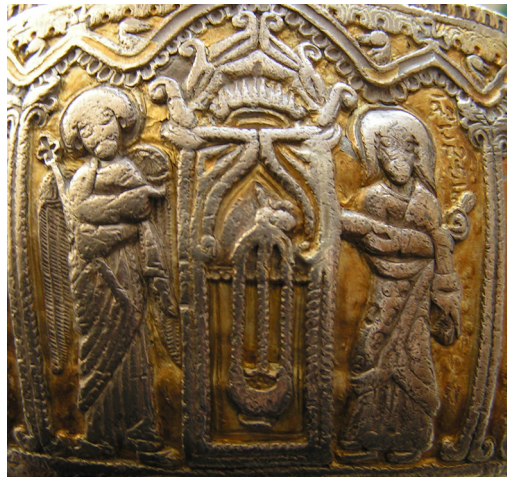
სურ. 3. აარონი საცეცხლურით ხელში და მთავარანგელოზი გაბრიელი

მეორე ფირფიტაზე, მის ცენტრში, ეკლესიაში დგას ჯაჭვებზე დაკიდებული საცეცხლური, რომელსაც ებრაელი მღვდელმთავარ აარონს ხელით უჭირავს (სურ. 3).