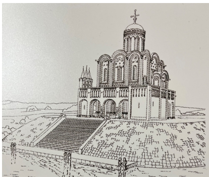
№ 4. საფარველის ეკლესია მდინარე ნერილიზე - საერთო ხედი