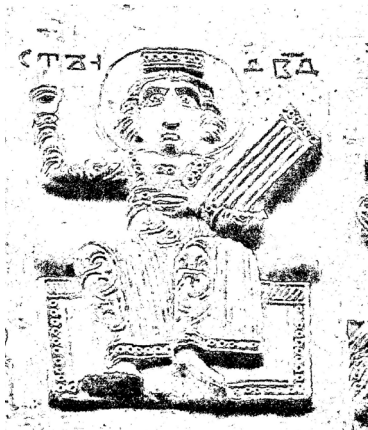
№ 2. დავით მეფესალმუნის ბარელიეფის ფოტოსურათი