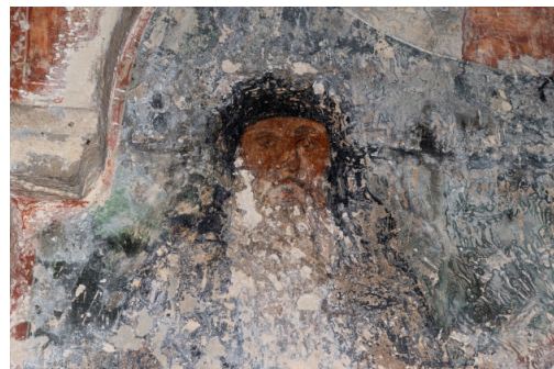
სურ. 6 ჯუმათი. სავარაუდოდ მიქელ ყოფილი სუიმონ გურიელი

საბერო ჩოხის ფესვედი სამოსის მხოლოდ ერთი ქვედა, ყავისფერი ბოლო გაირჩევა.