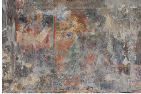
სურ. 2 ჯუმათი. „მიძინება“ (ფრაგმენტი) და წმ. იოანე დამასკელი

და ბალკანეთის ქვეყნების მოხატულობებში XIII-XIV საუკუნეებიდან ჩნდება (Schiller, 1972: 83). მის მომდევნოდ, უფრო ფართო თაღოვან სიბრტყეზე „ჯვარცმის“ სცენათა ნაწილები, დასავლეთ კედელზე - „გარდამოხსნისა“ და „დატირების“ მრავალფიგურიანი, ემოციური დეტალებით დატვირთული სცენები, ხოლო ჩრდილოეთით - „ჯოჯოხეთის წარმოტყვევნის“ კომპოზიციის ფრაგმენტი ჩანს. ფრაგმენტულად იკითხება დასავლეთი კედლის მეორე რეგისტრზე „ღმრთის-მშობლის მიძინების“ გავრცობილი სცენაც (სურ. 2), რომლის ორსავ მხარეს, თუმც გამყოფი ხაზით განცალკევებული, მაგრამ არსობრივად მასთან დაკავშირებული, იკონოგრაფიული ნიშნების მიხედვით ამოცნობილი იოანე დამასკელისა და კოზმა მაიუმელის (Konstantinidi, 2018: 87), მთელი სხეულით წარმოდგენილი, გაშლილ გრავილებიანი ფიგურები ლიტურგიკული შინაარსით ავსებენ სცენას (Этингоф, 2000: 213-217). ჯუმათის კედლის მხატვრობის