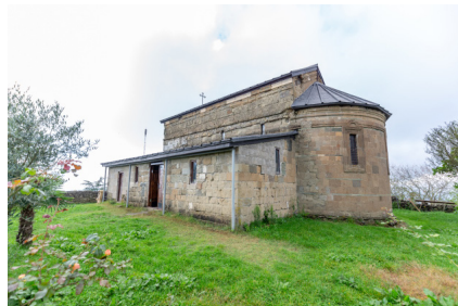
სურ. 1 ჯუმათის მთავარანგელოზთა მონასტრის ეკლესია

ჯუმათის მთავარანგელოზთა მონასტერი (სურ.1), რომელიც გურიაში, ოზურგეთიდან 14-ოდე კმ-ის დაშორებით, ჩოხატაურის ქედის ერთ-ერთი მწვერვალის ვიწრო თხემზეა აღმართული და არის „დიდშენი, მჭურეტი ზღვისა და გურია-ოდიშისა“ (ბატონიშვილი ვახუშტი, 1973: 790), გურიის სამთავროში შემავალი სამი საეპისკოპოსოდან ერთ-ერთია, რომელშიც შედიოდა ზემო გურიის მონაკვეთი რიონიდან სუფსამდე (ბატონიშვილი ვახუშტი, 1973: 790; ჩხატარაიშვილი, 1990: 146). საეპისკოპოსო კათედრის ჯუმათში დაარსების თარიღად XV საუკუნეს მიიჩნევენ (ქართველიშვილი, 2006: 18-22), თუმცა თავად ეკლესია, სავა რაუდოდ, XIV ს-ის II ნახევრამდეა აგებული (ჩხატარაიშვილი, 1959: 618). მოხატულობის ადრეული ფენის ფრაგმენტები კი იმას მიანიშნებს, რომ ეკლესია XIV ს-მდე უნდა აეგოთ.